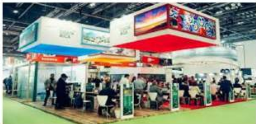
FERIA TURÍSTICA INTERNACIONAL WORLD TRAVEL MARKET- LONDRES