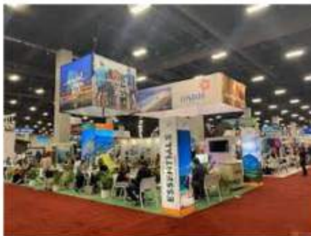
IMEX AMÉRICA LAS VEGAS 2024 OCTUBRE 2024