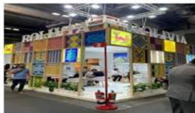
FERIA INTERNACIONAL DE TURISMO- FITUR ESPAÑA ENERO 2025