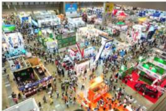
FERIA JATA TOURISM EXPO JAPAN -OSAKA-JAPON SEPTIEMBRE 2024