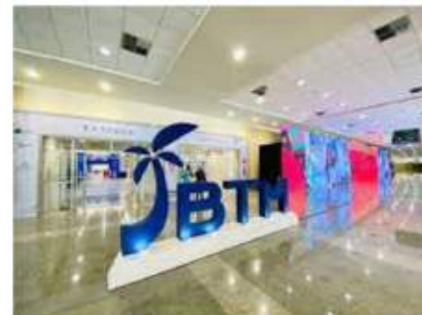
BTM BRAZIL TRAVEL MARKET OCTUBRE 2024